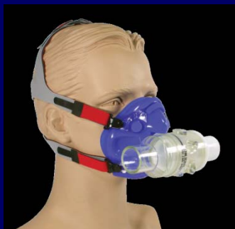
マスク+T-Shape 2WayValve+マジックテープヘッドギアアセンブリ