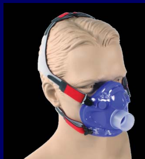
マスク+ポートアダプタ+マジックテープヘッドギアアセンブリ