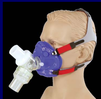
マスク+Y-Shape 2WayValve+マジックテープヘッドギアアセンブリ

マスクサイズは、Petite, Extra S, S, M, Lの5サイズがあります。