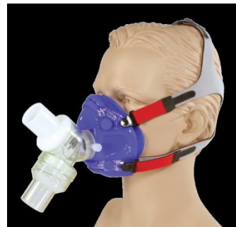
マスク+Y-Shape 2WayValve +マジックテープヘッドギア

マスクサイズは、Petite, Extra S, S, M, Lの5サイズがあります。