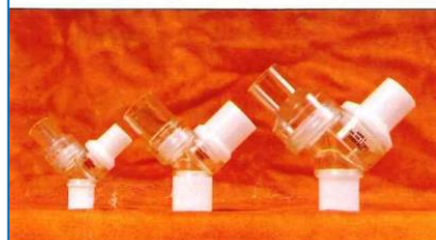
Two-Way Y-Shape Non-Rebreathing Valves