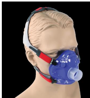
マスク+ポートアダプタ +マジックテープヘッドギア